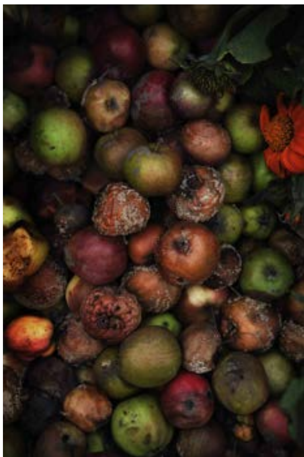
Kompost 5 80 x 120 cm. Canson Edition Etching Rag 310 g. Upplaga 1/10

År 2009 kom det första uttrycket för detta genom utställningen Kompost . Bilderna av växter i putrefaktion och förmultnande kan ses som en metafor över åldrandet och vårt fortlöpande förfall samt vår eventuella pånyttfödelse.