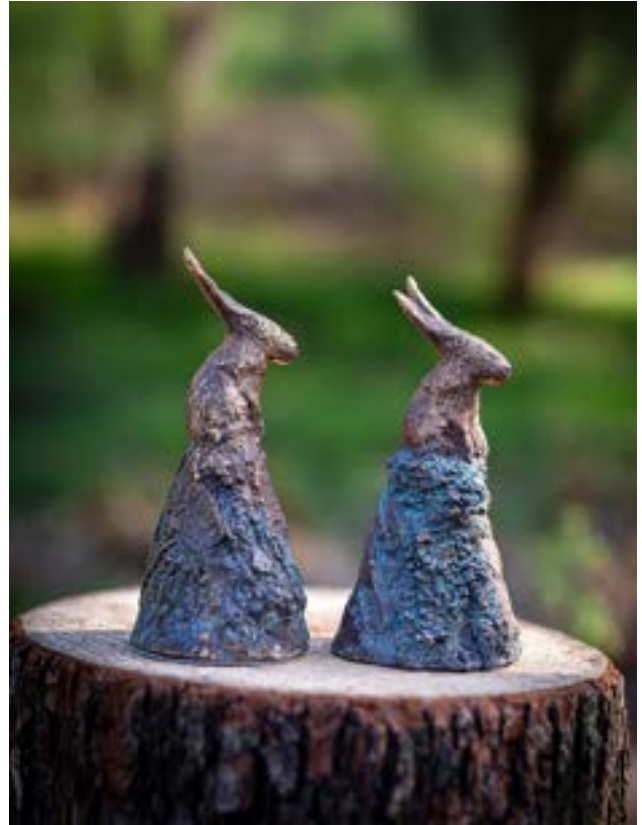
Hope, bronsoriginal ca 10 cm, ur serien: Gaia och fabeldjuren

Kreativitet är för mig att andas, det är min livsluft och undersökande processer är att leva. Att skapa är livsviktigt för mig, ibland har jag önskat att drivkraften kunde mattas av, det vore enklare, men är inget alternativ. Det kreativa uttrycket har tagit många skepnader och materialval genom 30 år som konstnär och konsthantverkare.