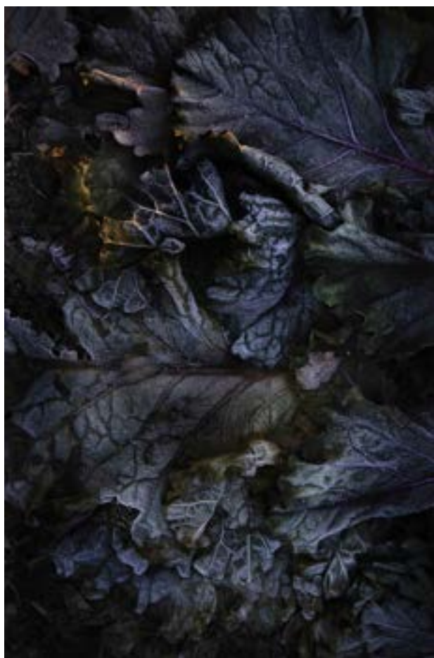
Kompost 10 80 x 120 cm. Canson Edition Etching Rag 310 g. Upplaga 1/10