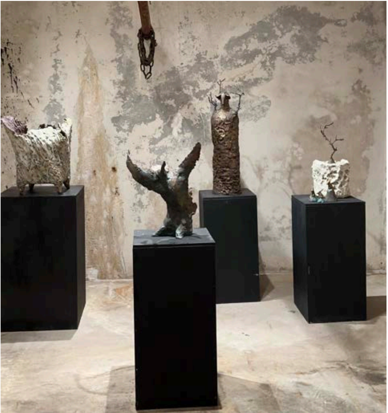
Grottan, Gamla Kraftstationen i Deje, Värmland

Jag har bl.a utbildat mig på konstlinjen på Nordvästra Skånes folkhögskola, HDK Göteborg linjen för keramik/konst, masterexamen keramik/unikat på Danmarks designskole i Köpenhamn. Efter examen har jag arbetat heltid med konst och konsthantverk, sedan 10 år tillbaks i Funkishuset villa Sol i Förslöv.