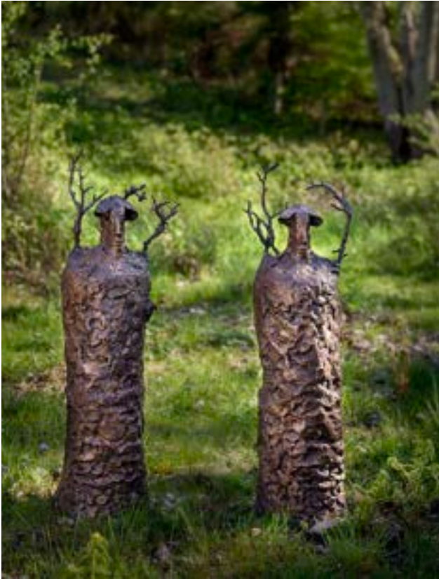
Skogsträd, bronsoriginal, höjd ca 1 meter, Sinarpsdalen Båstad